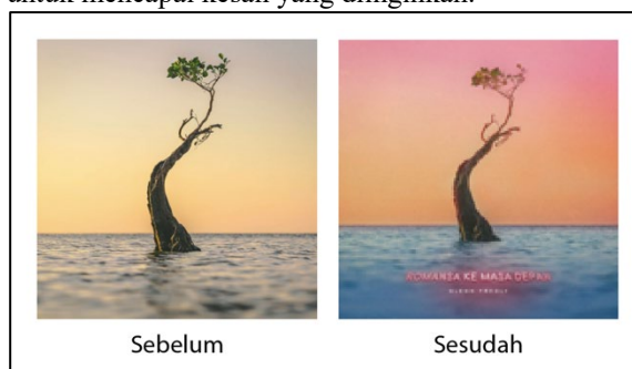
Gambar 6 Perbandingan pengolahan warna foto

Warna yang digunakan juga termasuk lebih lembut jika dibandingkan dengan warna dari album-album Glenn Fredly sebelumnya yang terlihat pada Gambar 5. Warna dari album romansa ke masa depan diperoleh dari pengolahan teknik foto digital, untuk mencapai kesan yang diinginkan.