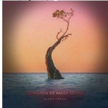
Gambar 9 Penekanan pada desain sampul album 'Romansa Ke Masa Depan'

Prinsip desain berikutnya adalah penekanan ( emphasis ), penekanan pada desain sampul album ini terletak pada pemanfaatan fokus di foto pohon bakau yang berdiri diatas laut, dengan menjadikannya fokus pusat perhatian nan menarik pada karya desain ini. Dapat dilihat dari, peletakan yang berada di tengah-tengah karya desain, selain itu penekanan juga dapat dilihat dari segi ukuran. Ukuran pohon yang jika diperhatikan memiliki proporsi lebih besar dari elemen desain lainnya, serta adanya kontras antara warna pohon dan warna latar pada karya desain, sehingga mata audiens terfokus pada bagian tengah sampul album.