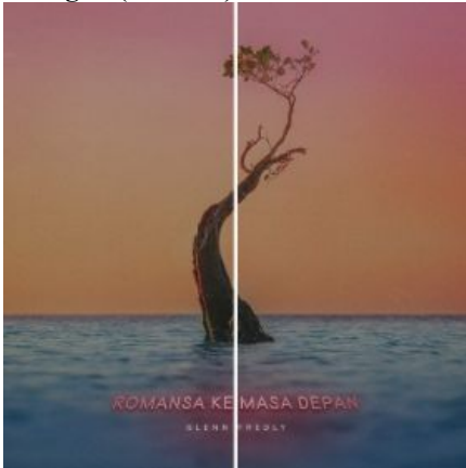
Gambar 7 Keseimbangan desain sampul album 'Romansa Ke Masa Depan'

Selain kesederhanaan, prinsip keseimbangan juga jelas terlihat dari komposisi fotonya. Jarak yang seimbang antara pohon, langit serta laut. Prinsip kesatuan juga diterapkan dari keutuhan seluruh elemen pada desain sampul ini. Sedangkan penekanan dalam sampul album rekaman ini terletak pada objek pohon bakau yang berdiri di atas lautan tepat di tengah karya desain ini, berikut penjabaran secara detail dari prinsip desain yang ada pada album album 'Romansa Ke Masa Depan'.