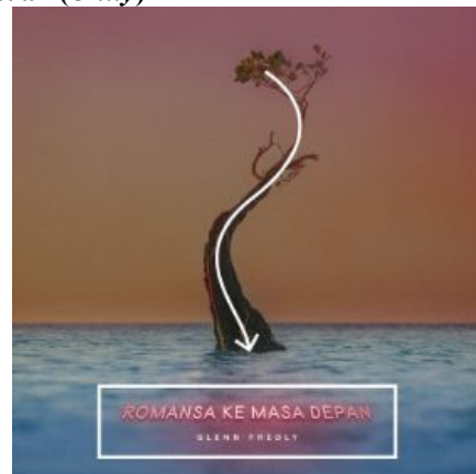
Gambar 10 Alur baca yang mengikat kesatuan elemen desain sampul album 'Romansa Ke Masa Depan'