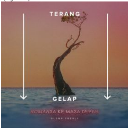
Gambar 8 Irama pada desain sampul album 'Romansa Ke Masa Depan'

Penerapan prinsip irama/ritme pada elemen-elemen desain album album, terdapat pada penggunaan gradasi warna antara warna latar dan pohon yang digambarkan dalam peralihan warna terang menuju gelap. Pada umumnya audiens melihat terang terlebih dahulu sebelum gelap, karena warna