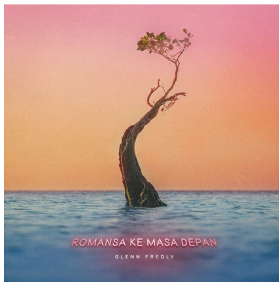
Gambar 1 Desain sampul album rekaman Glenn Fredly 'Romansa Ke Masa Depan'

Pada tahapan ini peneliti mengkaji elemen desain secara denotatif di dalam desain sampul album 'Romansa Ke Masa Depan', berikut adalah tampilan dari objek penelitian: