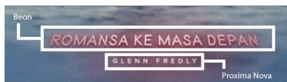
Gambar 4 Penggunaan typeface pada album album 'Romansa Ke Masa Depan'

Typeface yang digunakan adalah Beon untuk judul dan Proxima Nova untuk nama. Penggunaan jenis huruf pada judul bergaya neon disesuaikan dengan tema yang mengusung nuansa '80-an. Pada nama Glenn Fredly menggunakan font san-serif dengan ukuran lebih kecil dibanding judul utama. Sedangkan pada judul penggunaan font bergaya neon diberikan efek menyala ( glow ) layaknya lampu neon sign sehingga mendapatkan kesan khas 80-an.