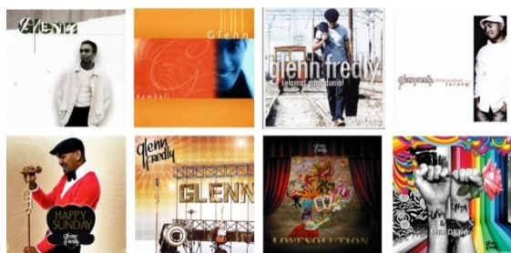
Gambar 5 Kumpulan desain sampul album rekaman Glenn Fredly tahun 1998-2012