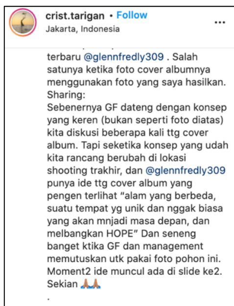
Gambar 11 Keterangan makna pohon bakau pada album 'Romansa Ke Masa Depan'

Pada tahapan ini peneliti mengkaji makna simbolis dan metafora yang terdapat di dalam album album 'Romansa Ke Masa Depan'. Pada karya desain kita dapat melihat bahwa objek utama adalah pohon bakau yang berada di tengah lautan.