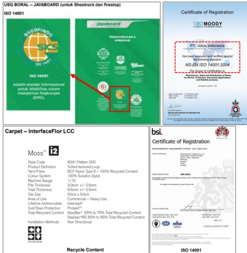
Gambar 4. Spesifikasi dan sertifikasi material ramah lingkungan yang dipilih (Tim Pengabd, 2024)

Pada kriteria ini, kami membantu mitra merencanakan material-material yang akan digunakan pada ruang interior serta melakukan penghitungan bobot material ramah lingkungan menggunakan kalkulator MRC. Jenis material-material terpilih dapat dilihat pada Gambar 4 sedangkan hasil penghitungan kalkulator MRC dapat dilihat pada Tabel 3 .