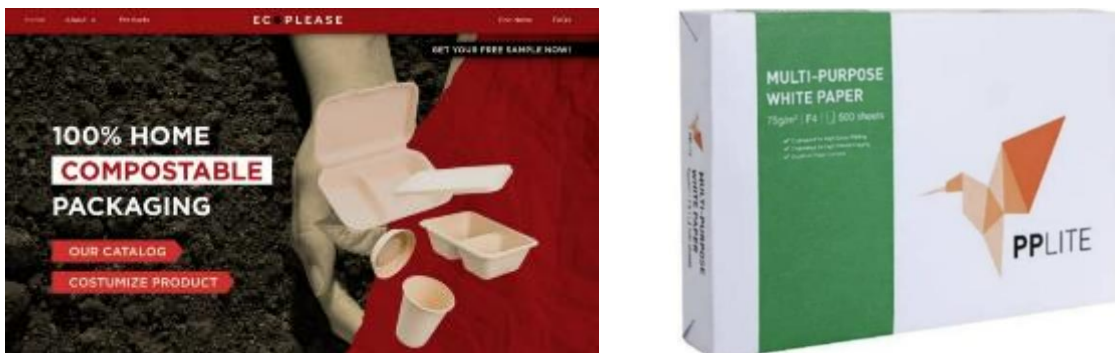
Gambar 7. Pilihan merk dagang untuk alat makan dan kertas yang sesuai tolok ukur

Pada kriteria ini, Tim Pengabdi mengusulkan merk kertas untuk keperluan perkantoran dan alat makan dan minum yang sesuai dengan kriteria yang sudah ditetapkan oleh GBCI ( Gambar 7 )