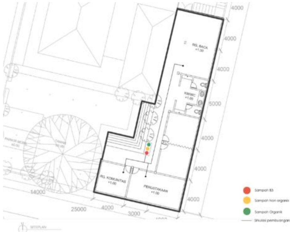
Gambar 6. Rencana peletakan fasilitas pengelolaan dan pemisahan sampah (Tim Pengabdi, 2024)